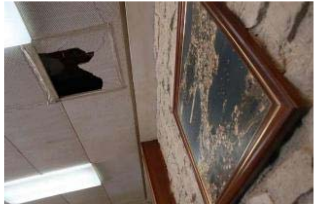
Los falsos techos de la Cofradía de A Illa se caen a pedazos. J.L.Oubiña

A. G. - A ILLA El lamentable estado en que se encuentra el edificio de la Cofradía de A Illa de Arousa está poniendo en peligro la celebración de los cursos de formación para marineros que imparte, así como la atención al público que se dispensa. La situación del inmueble es tal que los alumnos y profesores de los cursos de formación se ven obligados a celebrar las clases en aulas poco apropiadas para ello, sin luz, con un sistema eléctrico deplorable, llenas de humedad y con el techo cayéndose.