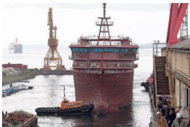
Botadura a finales de mayo de 2009 del tercer sísmico encargado por Petroleum Geo Services. R. Grobas

Sin embargo, el astillero vigués ofreció entonces al armador la entrega el primer sísmico, ya en avanzada construcción, en lugar del segundo con lo que los plazos se cumplirían. PGS no accedió al cambio en la entrega de la construcción número 533 por el contrato de la número 532.